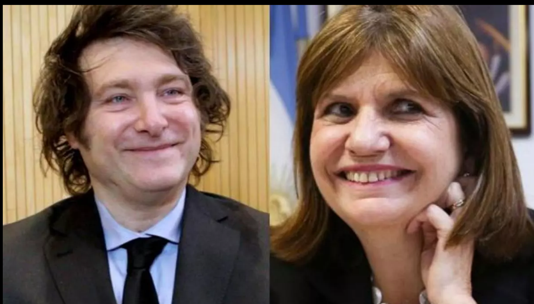
Javier Milei (a la izquierda) y Patricia Bullrich (a la derecha), las dos caras de la bronca popular del momento |

liberales son más directos: toda forma de empoderamiento, conquista social o cualquier derecho hablando de algo tan básico como puede ser la educación, “es una aberración de la justicia social”, en palabras expresas de Javier Milei.