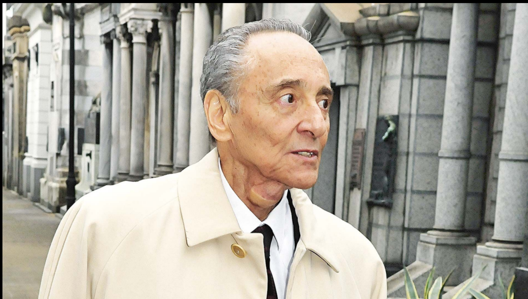
Héctor Magnetto, CEO y principal accionista del Grupo Clarín