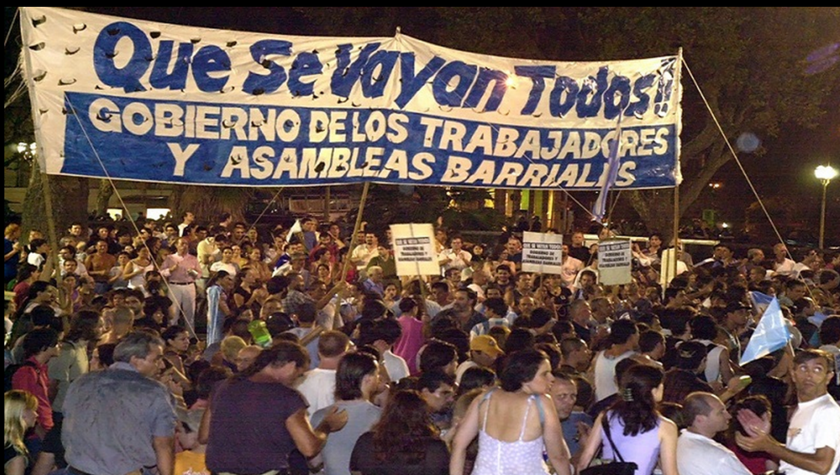
El “que se vayan todos” fue la consigna popular durante el estallido social del 2001

no es un rechazo a la política expreso, como se vio en la baja participación electoral que hubo en las elecciones PASO del pasado 13 de agosto. Por el contrario, es un rechazo a un tipo de política. El pueblo no acepta ni comparte la estrategia y la forma en la cual se conciben y desarrollan algunas lógicas, que al día de hoy ya no están teniendo correlato con la realidad.