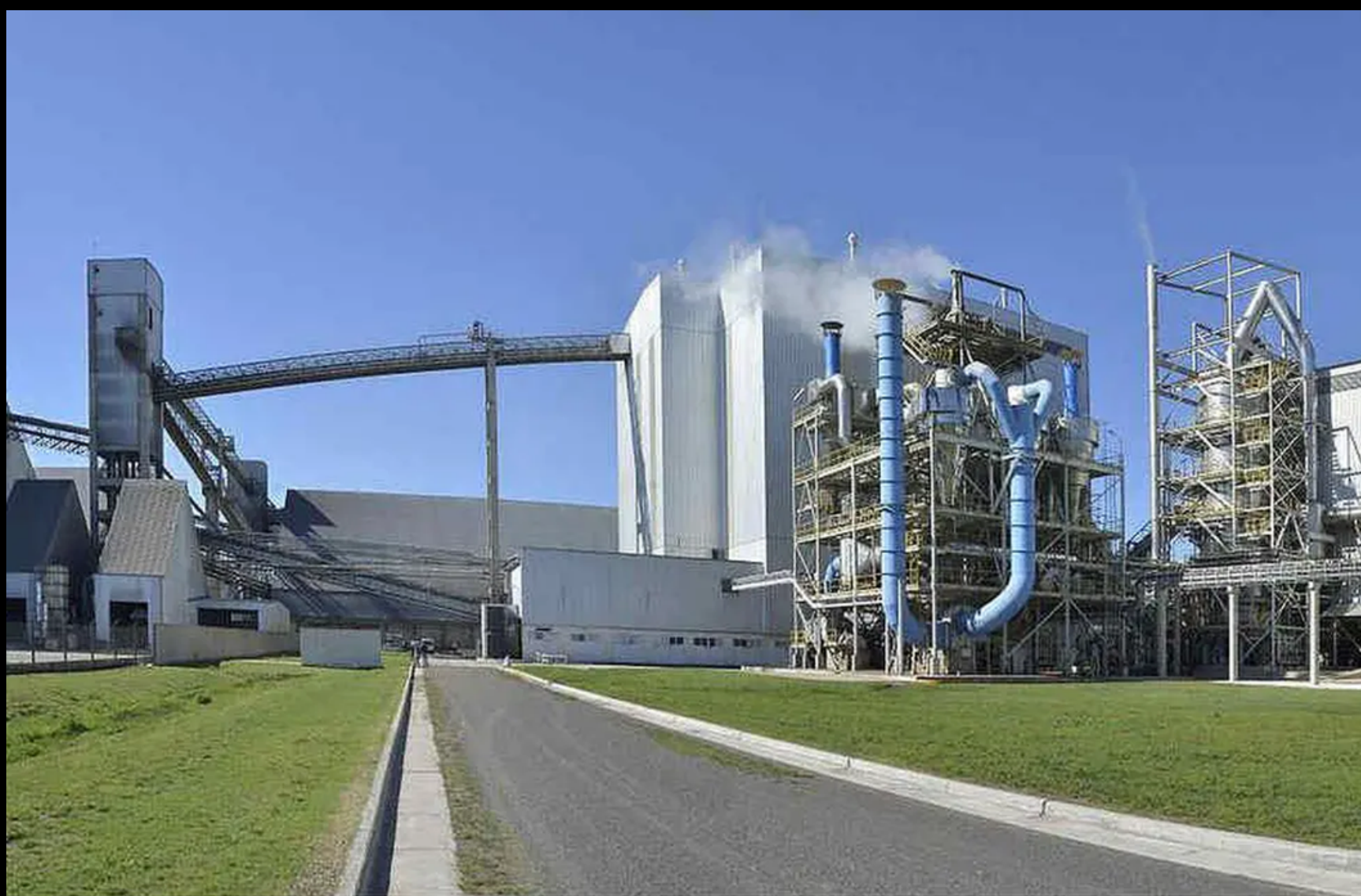
La planta de la Aceitera General Deheza (AGD)