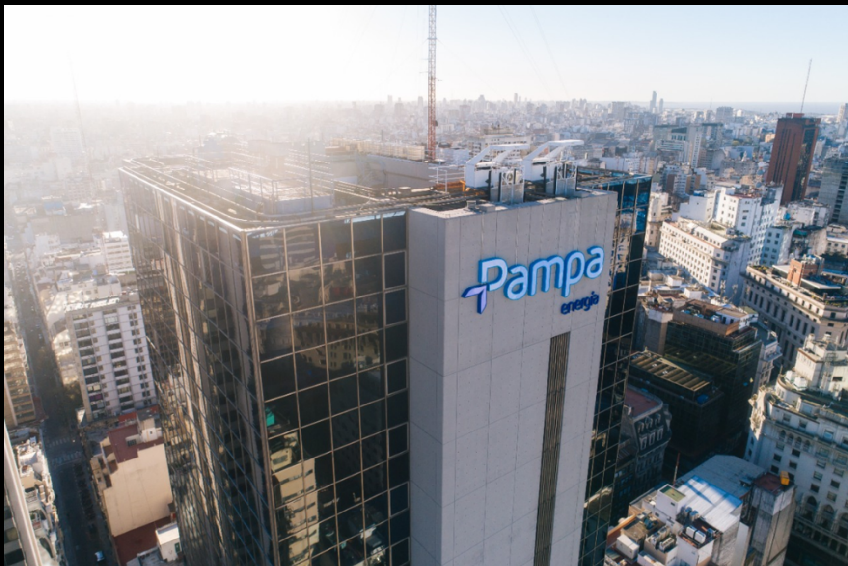
La sede nacional de Pampa Energía S.A.