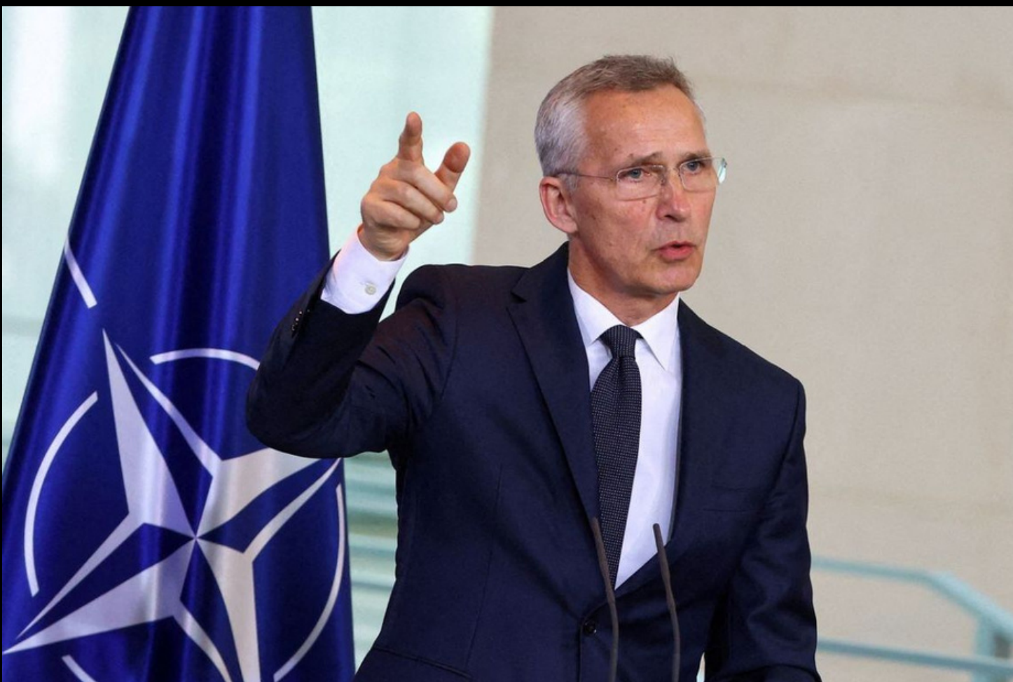
Jenn Stoltenberg, economista y político noruego, actual secretario general de la OTAN

Jens Stoltenberg, el mismísimo secretario general de la OTAN, explicó que la posición en el frente de batalla de Ucrania podría empeorar si Occidente no aumenta el suministro de armas. Y amplió: “El régimen de Kiev se encuentra en una situación crítica. Tenemos que prepararnos para las malas noticias”.